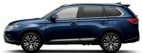
Tanzanite Blau D14 (P)

METALLIC- (M) / PERLMUTT- (P) LACKIERUNG