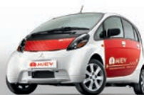
Das erste Elektroauto eines Großserien-Herstellers und der erste Plug-in Hybrid mit 4x4 Antrieb

Während Sie mit Ihrem Mitsubishi zufrieden sind, arbeiten wir bereits an der Erfüllung Ihrer automobilen Bedürfnisse der Zukunft.