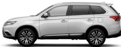
Silky Weiß W13 (P)