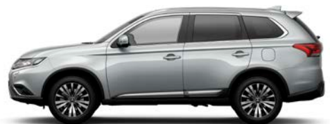
Sterling Silber U25 (M)