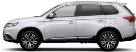
Frost Weiß W37