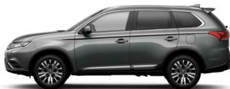
Medium Grau U17 (M)