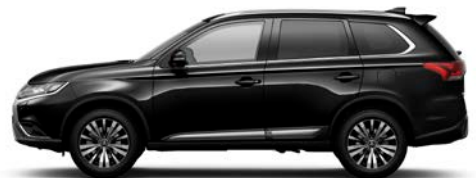
Amethyst Schwarz X42 (P)