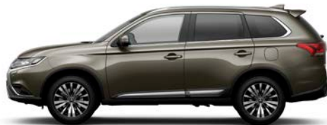
Granite Braun C06 (M)