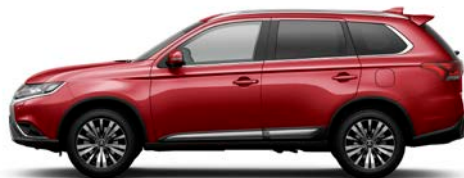
Orient Rot P26 (M)