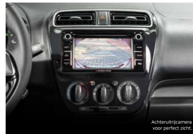
Achteruitrijcamera voor perfect zicht.